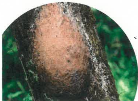
< nid de la processionnaire du chêne

La chenille se développe en automne et passe tout l'hiver dans l'œuf. En début de la période de végétation (fin avril, début mai), les chenilles éclosent. Elles passent alors par 6 stades de développement pour arriver à la nymphose. Dès le début, les chenilles sont très poilues, elles ont d'abord une coloration brun-jaune qui deviendra par la suite noir-bleuâtre. Sur 8 segments de l'abdomen, la chenille porte des zones constituées de poils soyeux de couleur brun-rouge, appelées miroirs. Sur ces derniers se trouvent à partir du 3 ème stade larvaire, des poils pourvus d'aiguillons urticants qui contiennent une toxine appelée thaumétopoéine. Le nombre, ainsi que la longueur de ses poils irritants augmentent avec chaque mue de la chenille. A la fin du 6 ème stade larvaire, la chenille peut atteindre une taille de 4 cm.