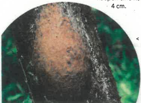
< Gespinst des Eichenprozessionsspinners

Zahl und Länge der Brennhaare nehmen mit jeder Häutung zu. Bis zum Ende des sechsten Larvenstadiums erreichen die Raupen eine Körperlänge von bis zu 4 cm.