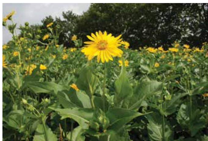
Blüte der durchwachsenen Silphie