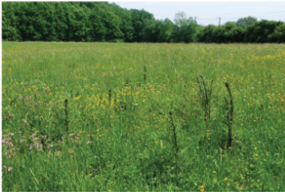
Abb. 1: Feuchtwiese.

Da die verschiedenen Lebensräume unterschiedliche Anforderungen in Bezug auf die Pflege haben, muss für jede SICONA-Pflegefläche ein spezifisch angepasster Pflegeplan erstellt werden. Ein Pflegeplan beinhaltet nicht nur Anweisungen zu den Pflegemaßnahmen einer