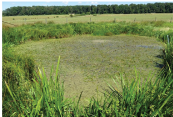
Abb. 4: Auch in Ihrer Gemeinde pflegt SICONA nach einem eigens erstellten Pflegeplan Naturschutzflächen. Im Bild sehen Sie ein Beispiel eines Stillgewässers im Gebiet „Mierchen“ in Redange.

Kontakt SICONA – Naturschutzsyndikat Wissenschaftliche Abteilung 12, rue de Capellen L-8393 OLM Tel: 26 30 36 25 E-Mail: administration@sicona.lu