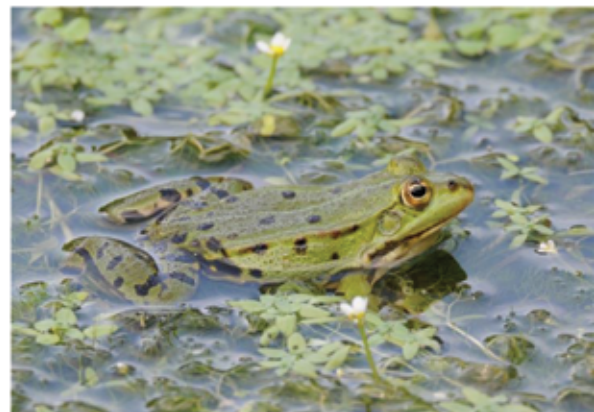
Abb. 2: Wasserfrosch. Foto: SICONA.

Die Pflegepläne werden dann über die folgenden Jahre vom SICONA-Pflegetrupps umgesetzt. Eine regelmäßige Pflege ist zum Erhalt der Artenvielfalt unerlässlich. Denn überlässt man die Flächen sich selbst, werden diese schnell von dominanten Pflanzenarten (z. B. Brennnesseln, Weiden, Brombeeren) eingenommen und verbuschen mit der Zeit. Daher ist es im Allgemeinen notwendig, Grünlandflächen (Abb. 1: Feuchtwiese. Foto: SICONA.